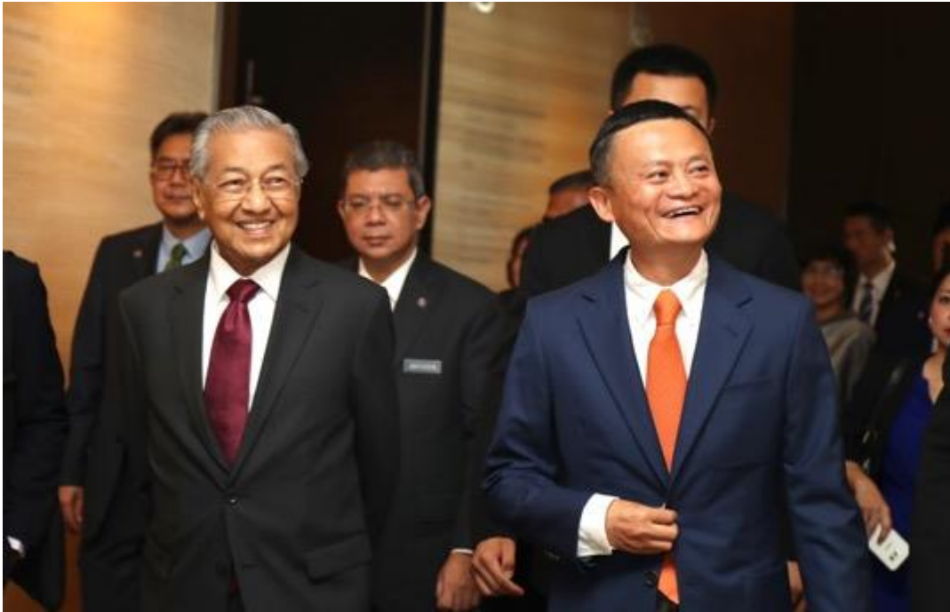
马来西亚首相敦马哈迪到访阿里巴巴杭州总部，阿里巴巴集团创始人兼董事局主席马云陪同

中国杭州，2018年8月18日 — 阿里巴巴集团今日在位于中国杭州的总部接待了马来西亚首相敦马哈迪·穆罕默德医生及其代表团成员，向其介绍了阿里巴巴如何利用技术改善人们生活，促进经济和社会发展。