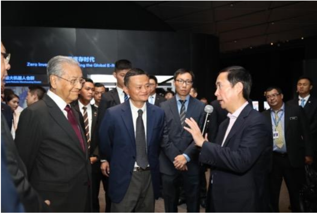
阿里巴巴集团首席执行官张勇陪同首相敦马哈迪博士参观了阿里巴巴展览馆，介绍了集团历史、成功故事、贡献和未来愿望的历程